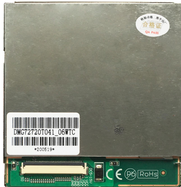
硬件接口图 Hardware interface